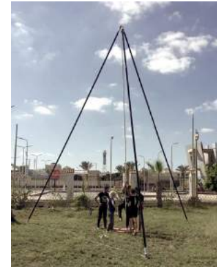
Vus de face